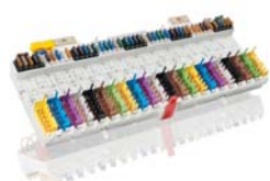
Impianto elettrico centrale