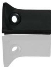
Mascherina cruscotto nera