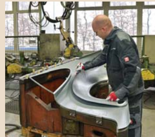
Taglio dei particolari di serie