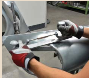
Finitura del cordone di saldatura