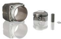
Kit pistoni e cilindri (596 - 604 G)