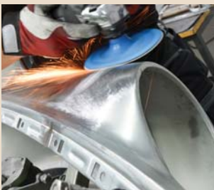
Finitura della superficie