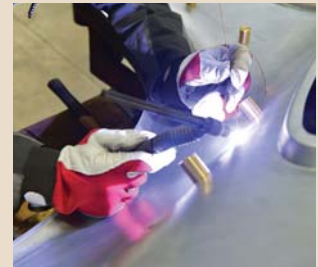
Spillatura di fiancata e codolino del parafrango